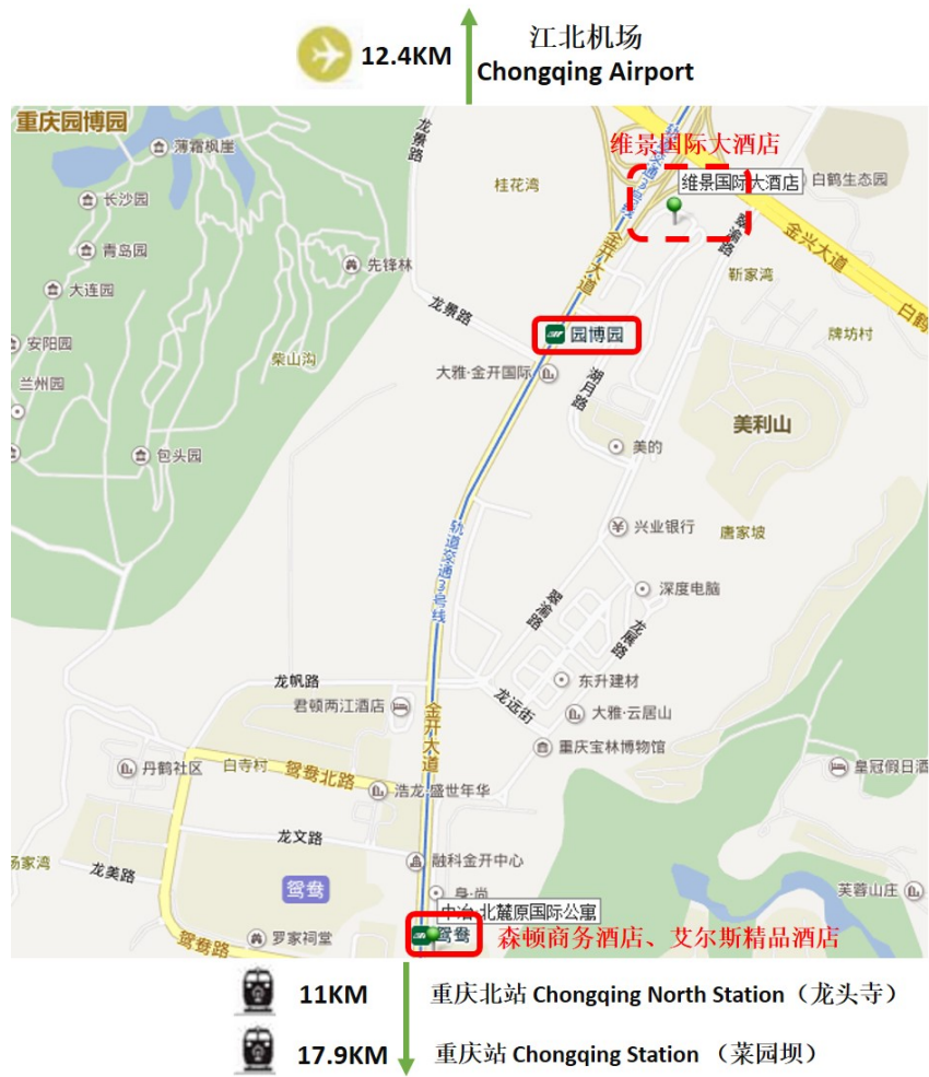
图 1 会场与入住酒店位置示意图