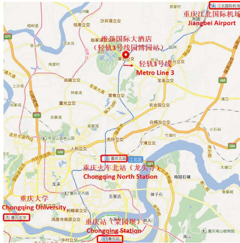
图 2 会场位置交通示意图